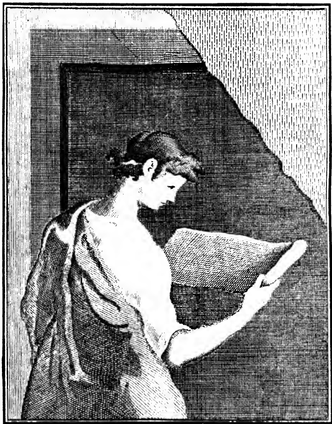
Halsted VanderPoel Campanian Collection