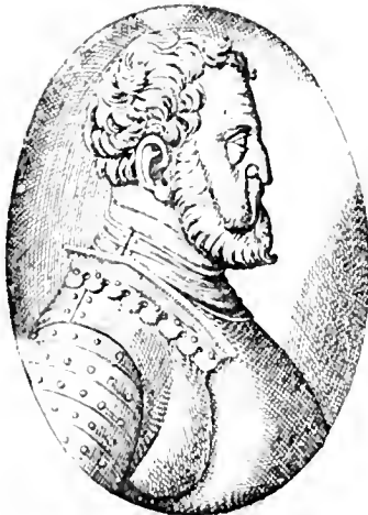
PORTRAIT D'ALPHONSE 1 er d'après les « Gravures » de Zenob (1569)

Du jour où je vis l'une à côté de l'autre les photographies des deux portraits, j'acquis la conviction que l'on avait affaire à deux personnages distincts : l'un reconnaissable à son nez crochu — un vrai bec d'oiseau de proie — et à ses formes