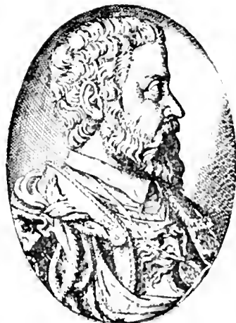
PORTRAIT D'ALPHONSE II d'après les « Gravures » de Zenob (1569)

1522. — Dans une dernière médaille du même, il