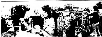
So könnte es immer sein auf den "Fabrik" - Bauspielplatz: die Kinder hämmern, sägen und bauen mit Begeisterung - wenn es zu schwierig wird, kann man einen Betreuer holen, der einem dann weiterhilft!

Die Vorbereitungsgruppe für das Strassenfest