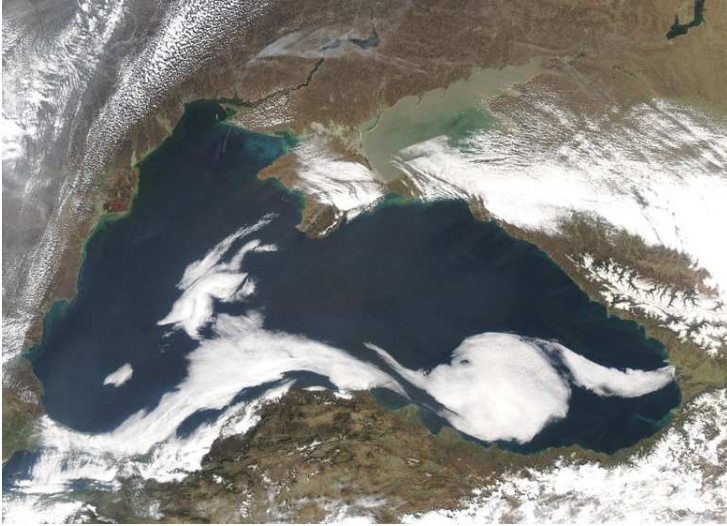
خارطة رقم 1

الغامق جداً لمياهه العميقة . فالأنة أبعد شمالاً من المتوسط وأقل ملوحة فإن تركيز الطحالب الأصغرية أكبر بكثير ويسبب اللون الغامق . ومدى الرؤية تحت الماء في البحر الأسود أقل بكثير من البحر المتوسط . إن الصورة الملتقطة من القمر الاصطناعي للبحر الأسود في خارطة رقم 1 أدناه لتظهر اللون الغامق بوضوح . فيتضح تماماً أن البحر الغربي في أسفار ذي القرنين لا يمكن أن يكون إلا البحر الأسود.